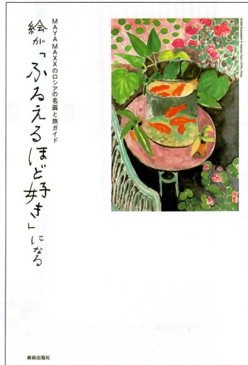
『絵が「ふるえるほど好き」になる』 MAYA MAXX 美術出版社 1,000円(税込)