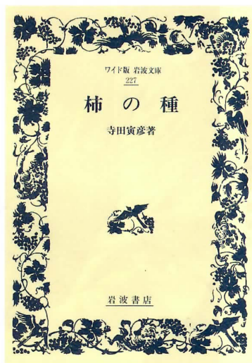
ワイド版岩波文庫『柿の種』 寺田寅彦 岩波書店 1,260円(税込)

そして音楽は、ライ・クーダーというギタリストの一枚。天才的なギターテクニクをもつ彼は、特にガラスや金属製の棒で弦に触れて音を出す演奏法、スライドギターの名手です。心の底からにじみ出るような深い響きがある彼の音色は、とても心地よく、演奏が終わってもなお、その余韻が残ります。ロックやブルースなど様々なジャンルを奏する彼の作品の中でも、ハワイアンやメキシカンテイストが強いこのアルバムは、スライドギターの表現力に磨きがかかった、代表作ではないでしょうか。